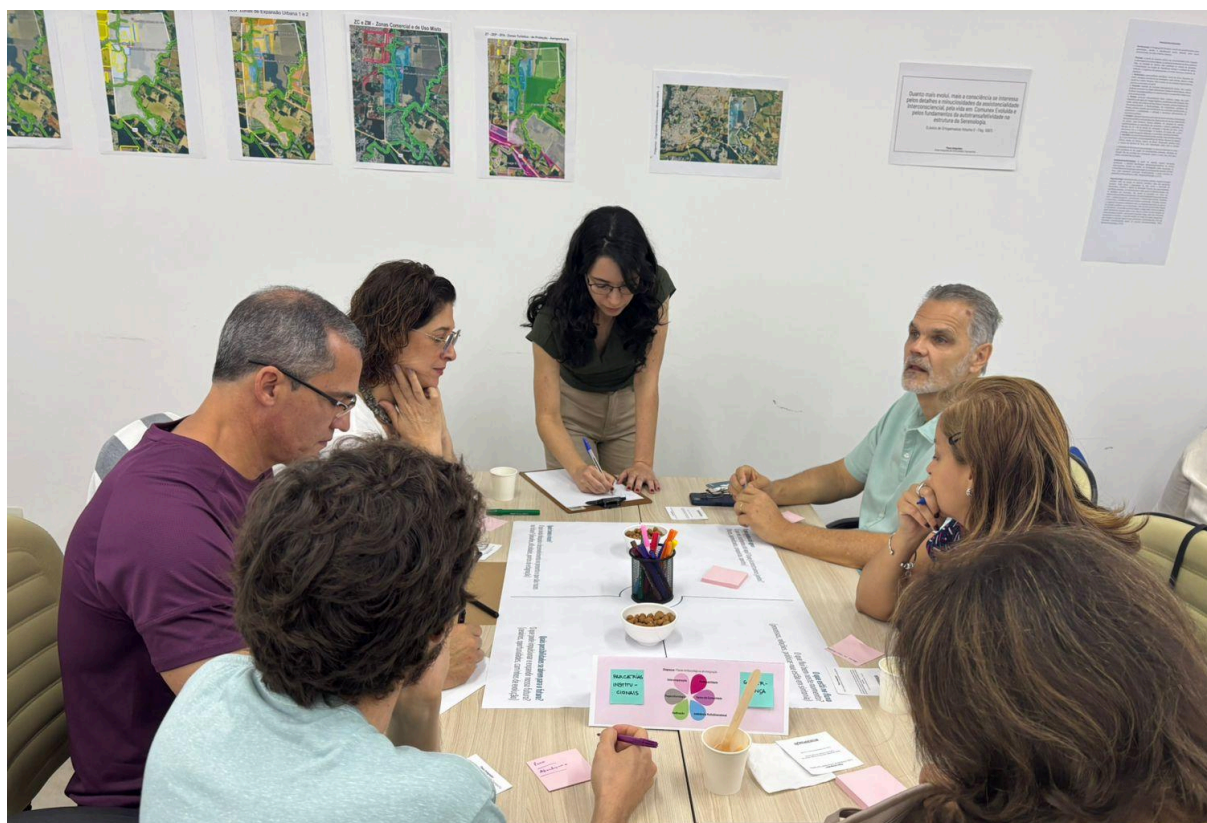
Foto: Ilustração de uma das 6 mesas durante a dinâmica de levantamento, em quadrantes, dos aspectos considerados favoráveis, no fluxo, riscos e possibilidades futuras , para cada qual dos 6 atributos anteriormente eleitos como coerentes com comunidades evoluídas.

Informações. Para saber mais sobre o Plano Integrador da Comunidade Cognopolita acesse o site https://unicin.org/plano-integrador/ , que disponibiliza documento de referência com o cronograma completo de atividades.