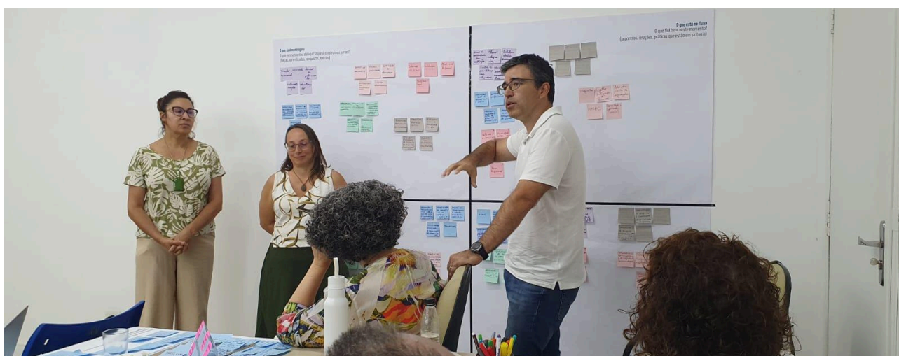
Foto: Sistematização e apresentação das sínteses de cada Mesa

Síntese. A partir desse processo de sistematização, cada grupo foi orientado a apresentar sua síntese ao coletivo, compartilhando os aprendizados, convergências, desafios e potenciais caminhos evolutivos identificados no diálogo. As principais palavras-chave e ideias foram registradas em post-its , os quais foram posteriormente fixados em um grande quadro coletivo, configurando uma síntese visual integrada dos resultados de todas as mesas.