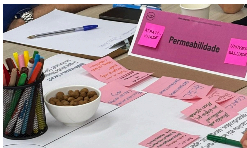
Foto: Em cada mesa, as respostas/sugestões a cada pergunta eram acolhidas e registradas no respectivo quadrante.