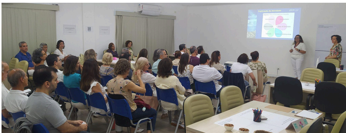
Foto: Exposição da metodologia a ser aplicada

Sorteio. Na recepção do evento, após o acolhimento do participante, este era encaminhado para a assinatura na lista de presença e seleção “às cegas” de um papel onde estava escrito o atributo (tema), orientando-o para a mesa onde iria iniciar a atividade prática. Essa dinâmica inicial teve por objetivo favorecer a integração entre os participantes e a composição equilibrada das mesas temáticas.