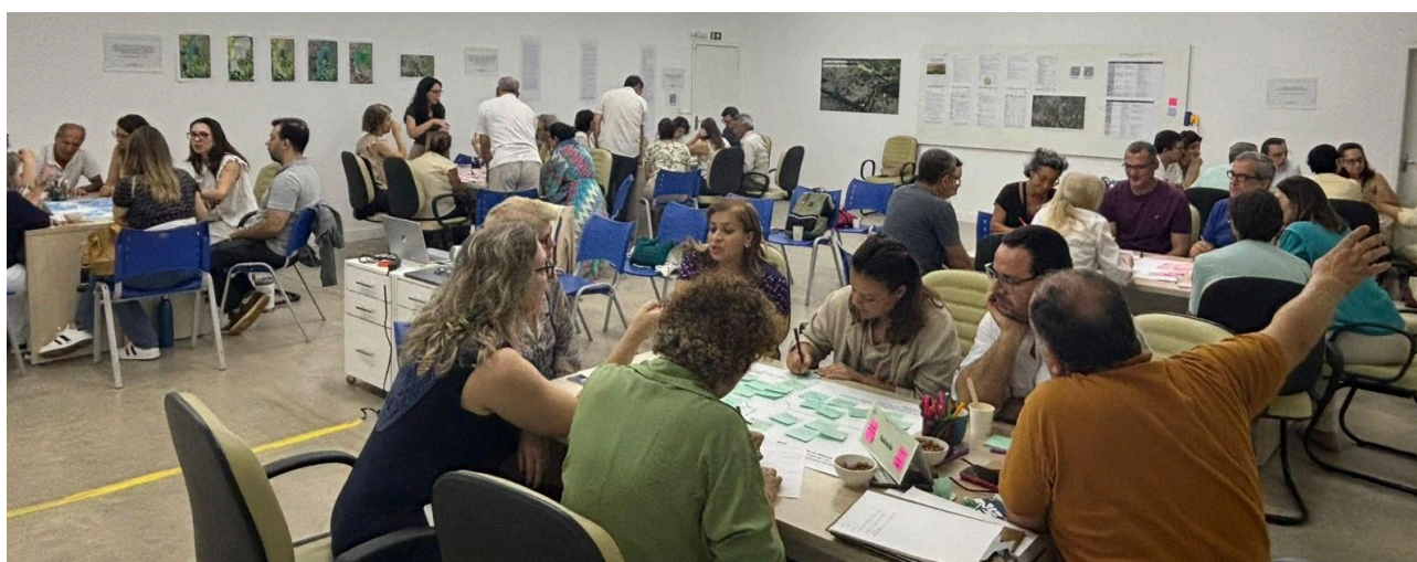
Foto: o trabalho nas 6 mesas aconteceu simultaneamente, na mesma sala.